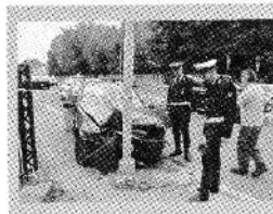
L'auto contro il palo in corso di Vittorio

VIGEVANO. Incidente ieri pomeriggio in corso di Vittorio. Un automobilista è andato a sbattere contro un palo della luce, dopo aver perso il controllo della vettura. Sul posto l'ambulanza della Cri di Vigevano e l'automedica, ferite lievi per il conducente dell'auto (p.a.v.)