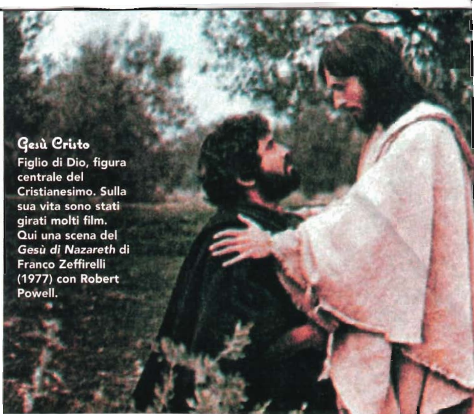
Gesù Cristo Figlio di Dio, figura centrale del Cristianesimo. Sulla sua vita sono stati girati molti film. Qui una scena del Gesù di Nazareth di Franco Zeffirelli (1977) con Robert Powell.